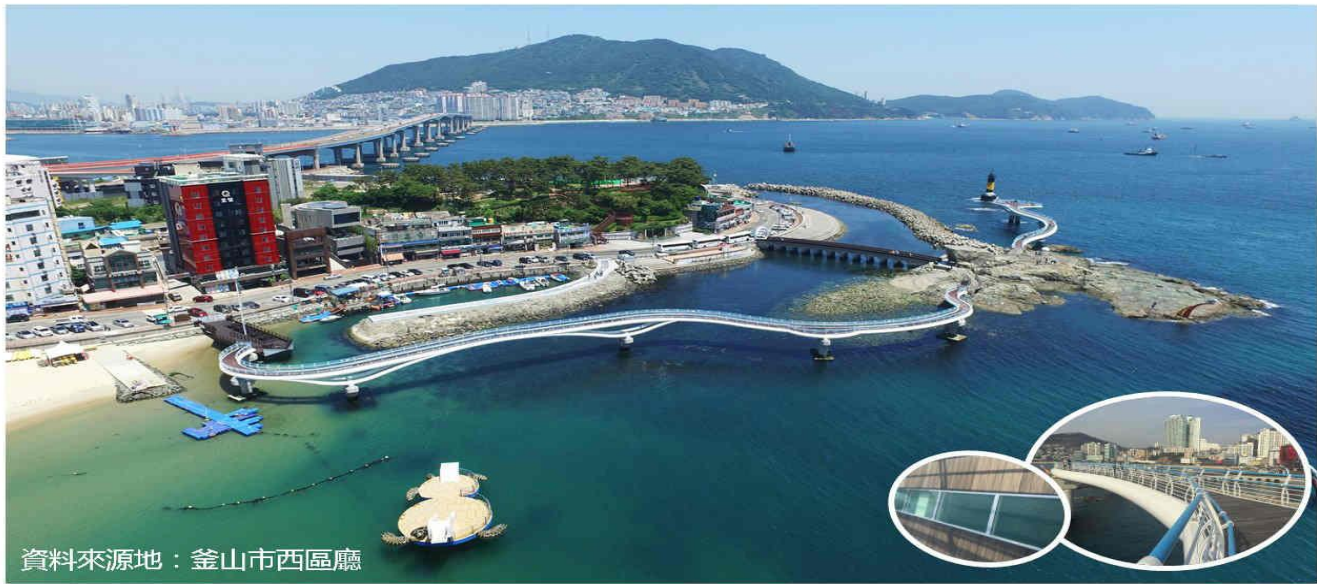
資料來源地：釜山市西區廳